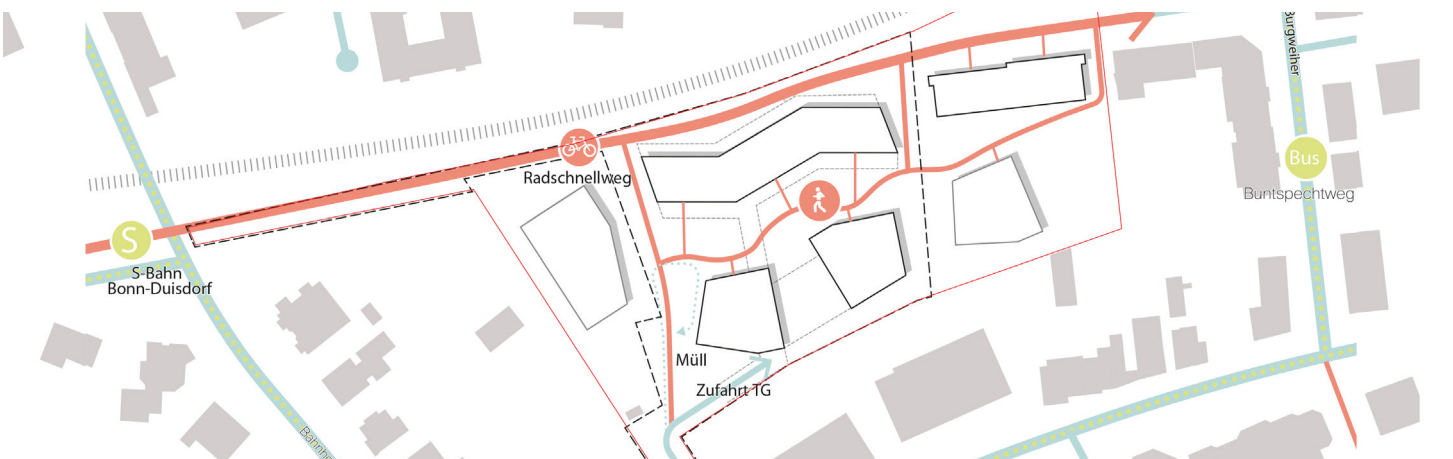
Mobilitätskonzept: Fokussierung auf ÖPNV und Rad- & Fußwege.