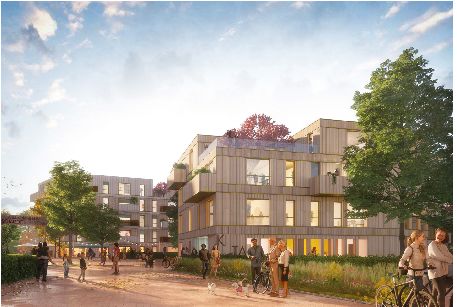
Blick ins lebhafte Schamotte-Quartier mit Holz-Hybridbauten und großzügigen Freiräumen.