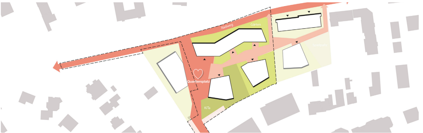
Städtebauliches Konzept: Eingebettet ins Stadtgefüge mit eigener Identität.